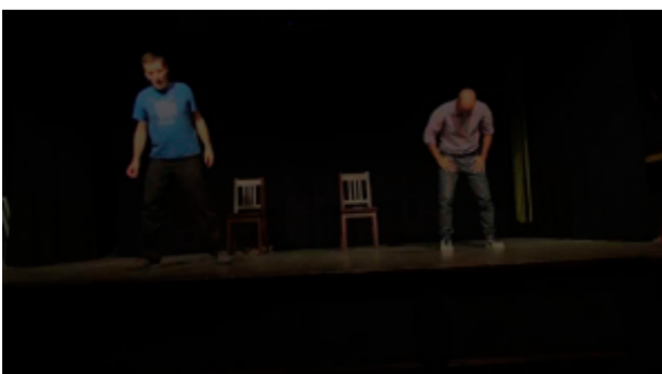
Fragen zum Sport